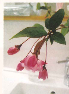
【全国大会 銅賞】「花」 千 坂 昇様(栗原市)