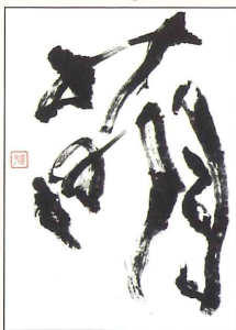
【全国大会 金賞】「萌」 青 山 良 子様(塩竈市)